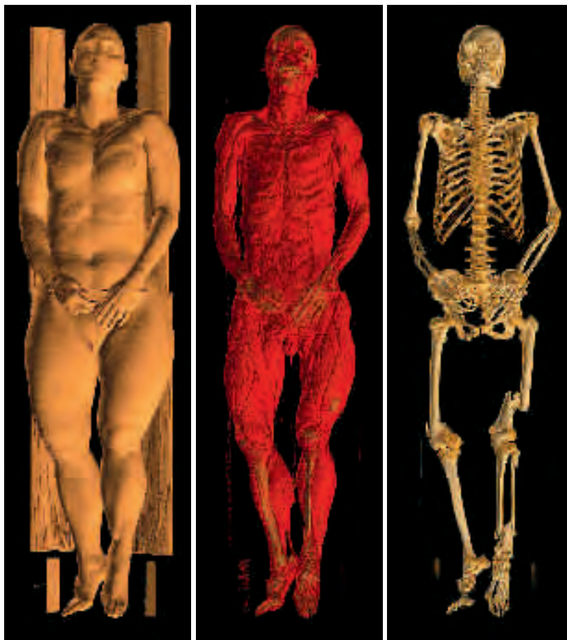
Datortomografien ger möjlighet att rotera bilden och i datorn skala av lager för lager i kroppen och undersöka olika kroppsdelar.

Sedan ett par år har datortomografitekniken tagit ett rejält steg framåt med väsentligt bättre bildkvaliteter och möjligheten att göra tredimensionella bilder. Samtidigt har det världsledande pionjärarbetet vid Center for Medical Image Science and Visualization vid Linköpings universitet möjliggjort visualisering och presentation av de stora informationsmängder som genereras vid datortomografiundersökningarna.