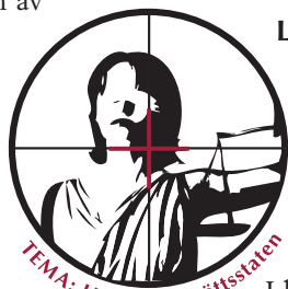
TEMA: Hoten mot rättsstaten

Allt skruvas upp och kompiserna, som vittnat om att inget hänt, får ta emot hot och han anklagas för att skydda en våldtäktsman.