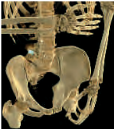
Datorbilden visar tydligt en kula i bäckenbenet.

Datortomografi – till skillnad mot vanlig slätröntgen som ger en platt bild utan djup – ger en detaljerad tredimensionell bild av kroppen. Det går sedan att rotera bilden och i datorn skala av lager för lager och undersöka olika kroppsdelar. Men för att bli ett användbart verktyg