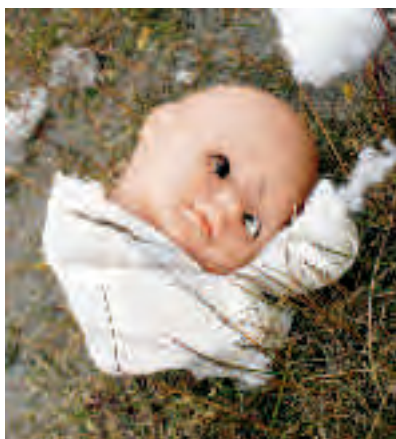
Ett barn som utsätts för sexuella övergrepp kan tvingas leva med bilderna på nätet hela livet.