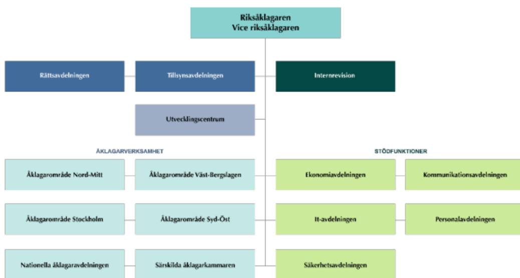
Bild 1. Organisationskiss över Åklagarmyndigheten och lista över åklagarområden, åklagarkammare och kansliorter från Arbetsordningen den 1 april 2025