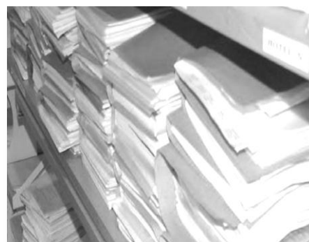
Åklagarna får inga fysiska akter - allt scannas till de elektroniska akterna

Riksenhetens organisation har utvecklats under året. Det administrativa stödet har koncentrats till kansliorten i Malmö. Nya ingående handläggningsföreskrifter har tagits fram. Åtgärderna syftar till att handläggningen inom riksenheten ska vara så enhetlig som möjligt och det administrativa stödet sätts in där det behövs bäst. Med ett