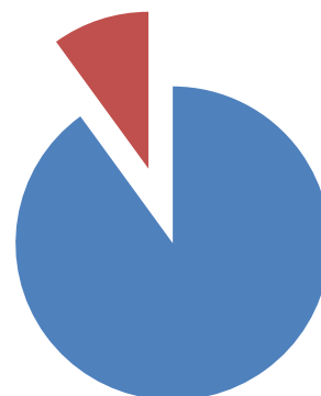
Lagföring sker endast avseende ett begränsat antal inkomna brott

Som redan framhållits skiljer sig den verksamhet som bedrivs vid riksenheten i väsentliga avseenden från verksamheten vid de allmänna åklagarkamrarna. Brottsmisstankar är inte heller ett användbart jämförelsemått. Det är således inte meningsfullt att t.ex. jämföra lagföringen, handläggningstider mm mellan riksenheten och de allmänna åklagarkamrarna. Som framgår under avsnitt 4. har Utvecklingscentrum Malmö vid sitt tillsynsuppdrag år 2012 avseende verksamheten vid riksenheten inte funnit skäl till kritik.