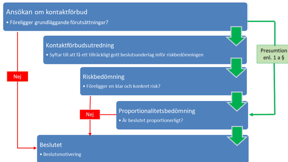
Bild 2 Prövningen av en ansökan om kontaktförbud

Handläggningen av ett kontaktförbudsärende görs i fem steg i enlighet med ovan illustration. Man bör inte bevilja ett kontaktförbud om man inte gått igenom alla fem stegen. Ett beslut om att avskrika eller avslå en ansökan om kontaktförbud kan göras i alla skeden.