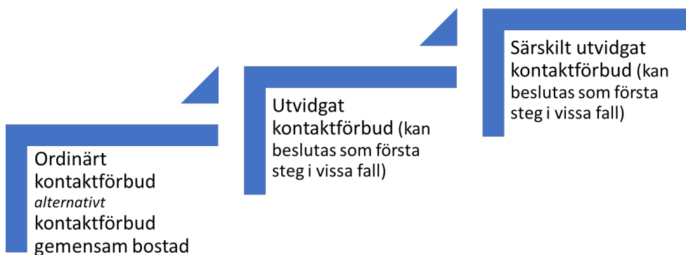
Bild 1 Kontaktförbudstrappan